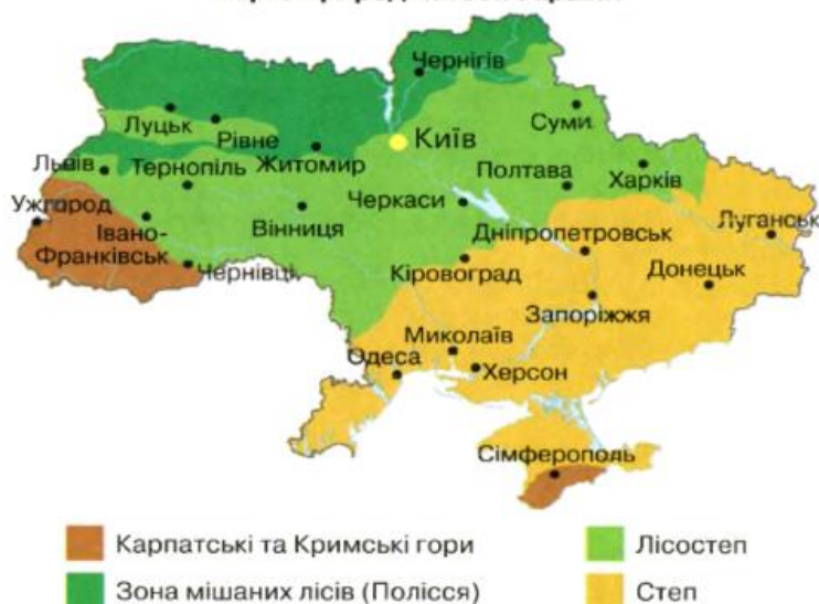
Карта природних зон України

Що далі на південь від зони мішаних лісів, то більше з'являється безлісних ділянок – ділянок степу. Перехідною зоною між зонами мішаних лісів і степу є лісостеп. Саме слово «лісостеп» складається з двох слів «ліс» і «степ». Лісостепова зона займає більше 200 тис. км 2 . В її межах розташовані Львівська, Тернопільська, Хмельницька, Вінницька, Харківська, Полтавська, Черкаська області. Характерною рисою зони є поєднання лісу і степу. Температура повітря -5°C - +20°C. Опадів випадає мало: 400–500 мм на рік. Територію перетинають ріки: Буг, Дністер, Дніпро. У зоні лісостепу переважають чорноземи та сірі лісові ґрунти. Лісостепова зона багата на корисні копалини: кам'яне вугілля, буре вугілля, нафту і горючі гази.